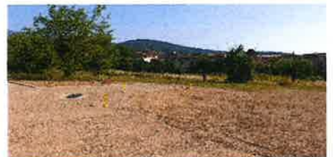
A droite : le même endroit après terrassement.

« Budget estimatif : 5 M d'euros entièrement porté par l'aménageur »