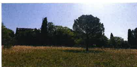
Pin, Cyprès Oliviers