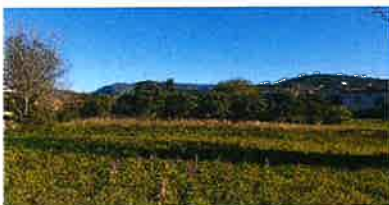
A gauche: un champ d'orchidées au-dessus du vieux réservoir

Pour rappel les jardins partagés communaux actuels sont minuscules, coincés entre bâtiments et parking alors que la demande des villageois est grande.