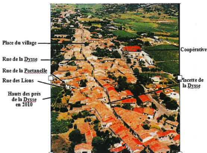
Photo sur le plan Guide Officiel de Montpeyroux Edition 2010

Il y a pourtant beaucoup de maisons en vente, en construction et des terrains déjà constructibles mais non vendus. Et il existe des mairies qui aident leurs administrés à clôturer les successions difficiles, à mettre aux normes les logements anciens ou à trouver des promoteurs intéressés par la rénovation plutôt que par la construction.