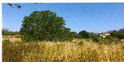
Un énorme noyer