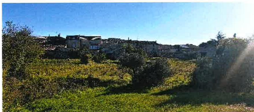
Les prés de la Dysse mai 2023