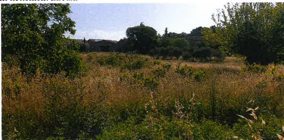
Les prés de la Dysse avril 2023

Si le SCOTT a dû être modifié (9 ha maximum d'artificialisation supplémentaire à se partager entre diverses communes) c'est principalement à cause du problème de l'eau et de la disparition de la biodiversité. Donc 60 logements sur 3 ha au lieu de 82 logements sur 11, 5 ha ne changent absolument rien au problème initial et ne font qu'empirer la situation. Sans parler des voitures, de la pollution et du bruit. Le projet de ZAC doit être abandonné. Les prés de la Dysse, s'ils doivent être exploités un jour, méritent nettement mieux.