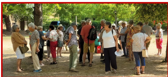
Un peu d'ombre