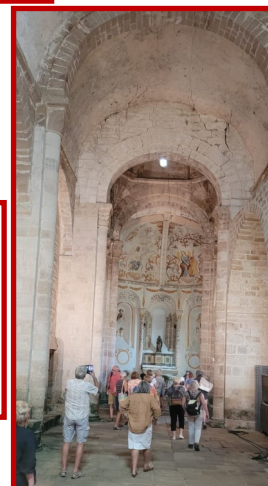
Intérieur de l'église