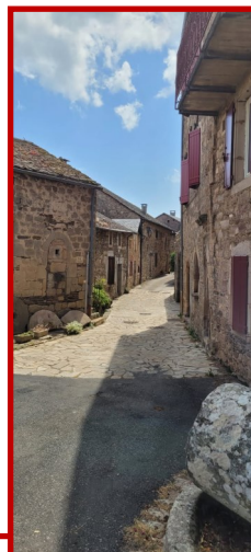
Castelnaud Pégayrols médiéval