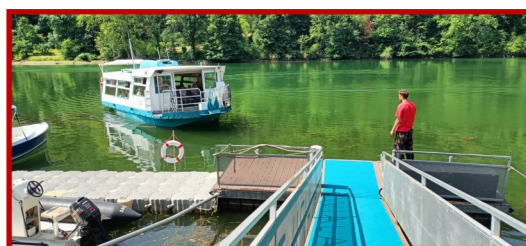
Le Tarn : bateau croisière