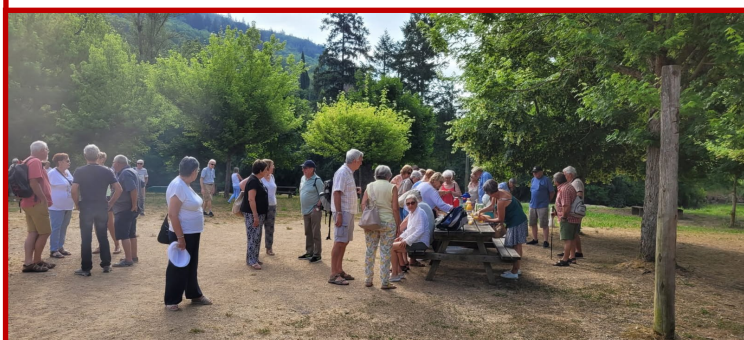
Pause : petit déjeuner